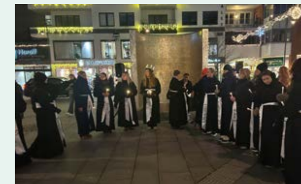
I år valgte vi markere at 17 kvinner ble drept i nær relasjon i Norge i 2025. Derfor kledde vi oss i sort og hadde på bærebukett bånd. En kvinne for hver kvinne!

I forbindelse med FN's internasjonale dag for avskaffelse av vold mot kvinner, 25. november, og de påfølgende 16 days of action, var vi med på ulike markeringer. Markeringen i Kristiansand var stor også i 2025 og det var mange aktører som var tilsluttet arrangementet. Til sammen utgjør vi aksjonsgruppen Stopp Vold Mot Kvinner Kristiansand/Agder.